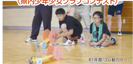
R1年度「ゴム動力カー」

各クラブと協力して子どもたちのものづくりへの興味関心を高めることなどを目的として7クラブで合同の「クラブコンテスト」を開催しています。