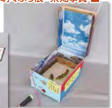
「ぞうをさがすぞう」