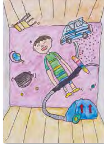
「重力すいとりにき」