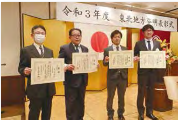
令和3年度東北地方発明表彰式

公益社団法人発明協会が実施する表彰等への応募の推薦を行っています。 また、叙勲・褒章や文部科学大臣賞など、各種表彰へ推薦を行っています。