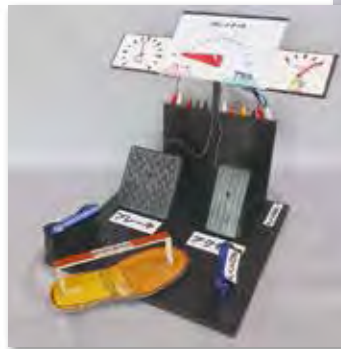
「まごの声でふむ前にお知らせ！ アクセル・ブレーキふみまちがえ 防止そうち発明」