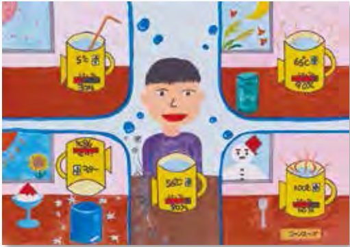
「-10℃~100℃まで温度変化するコップ」