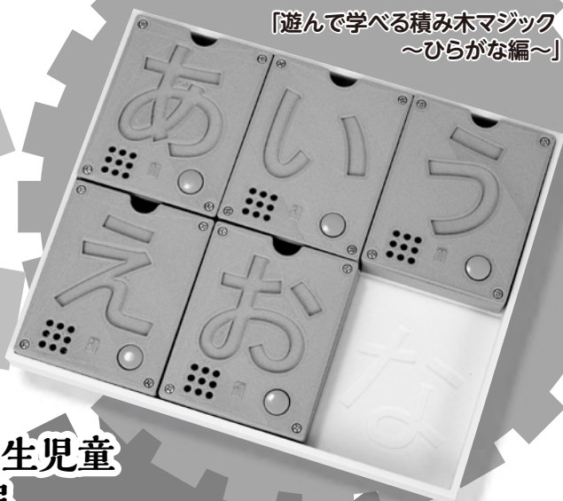
「遊んで学べる積み木マジック ～ひらがな編～」