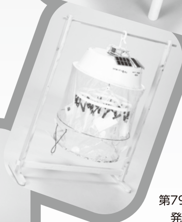
第79回全日本学生児童 発明くふう展 入選作品

私たちは、さまざまなアイデアを生かし、生活をより豊かで健康的なものにすることができます。